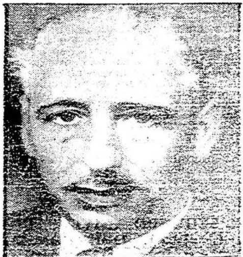
El señor Companys se dirigió anoche por radio a los ciudadanos de Cataluña. He aquí su discurso: «Catalanes:

¡Cada vez más firme la resistencia de todo el pueblo ante sus mortales enemigos! ¡Todos al combate, a la fortificación, al trabajo!