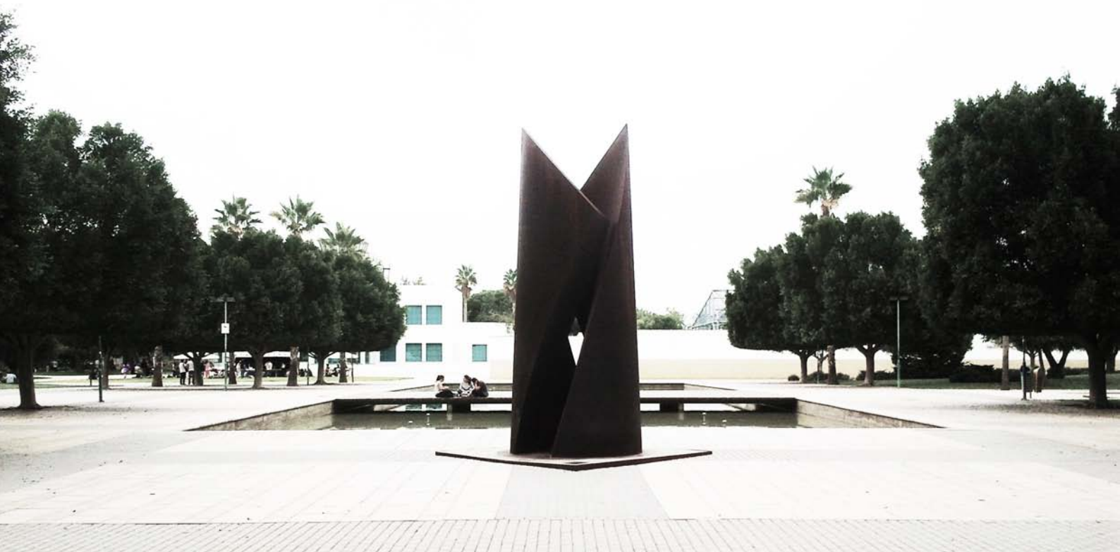
(*) Armonia. Jose Merino. Plaza of Equality. University of Alicante. 2013