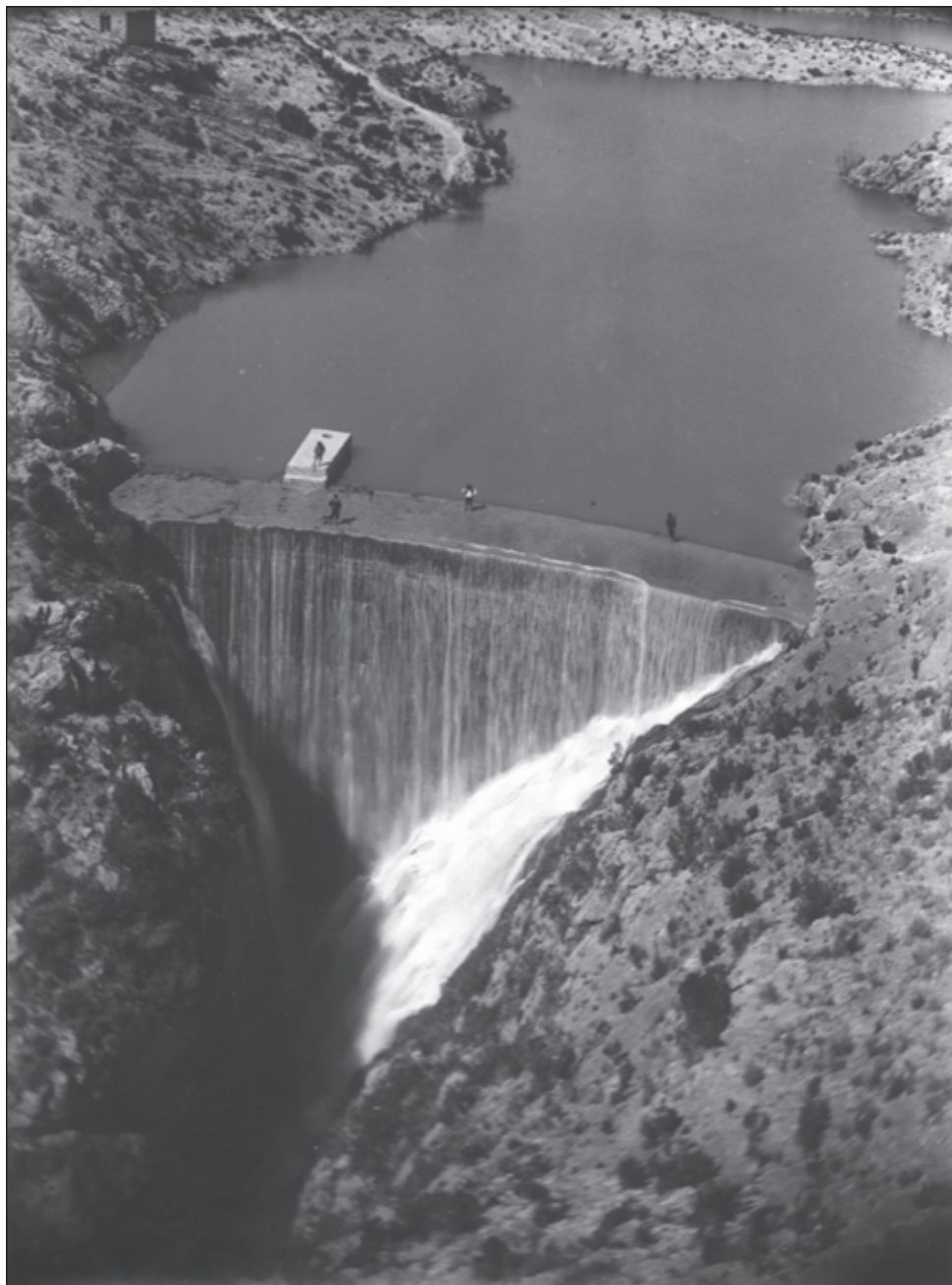
Foto 2. El pantano de Rellou en la última década del siglo XIX, cuando todavía era una pieza fundamental en el regadío de la huerta vilera. Obsérvese el vertido de excedentes por coronación y la presencia de la casa de guardia en la parte superior izquierda de la imagen.