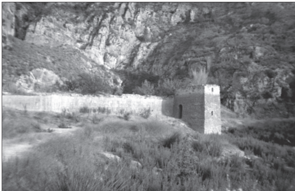
Foto 1. Detalle del estado actual de la presa vista desde aguas arriba. Sepultada bajo cerca de 30 metros de tarquines, tan solo sobresale el recrecimiento realizado en 1879.

ticamente así la de Elche (López, 1996). En ambas, el efecto arco interviene en su estabilidad y la esbeltez de la de Relleu, derivada de la relación entre altura y espesor, no fue superada hasta 1830 cuando el ingeniero Tholonet construyó la presa-arco de Zola (Navarro, 1994). A pesar de su importancia y de la visita a la región de científicos y técnicos de diversas nacionalidades, especialmente en el siglo XIX —cuando se proyectaban trabajos semejantes en diferentes países— los estudios más conocidos sobre riegos del Ochocientos, los del francés Aymard y el español Llauradó, omiten la de Relleu tras referirse a los embalses de Almansa, Tibi y Elche (López, 1971).